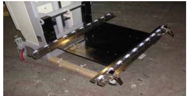
アングル型ローラーテーブル