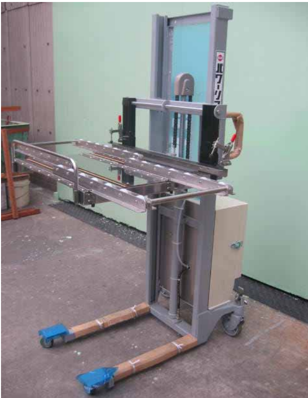
スライドアングル型ローラーテーブル